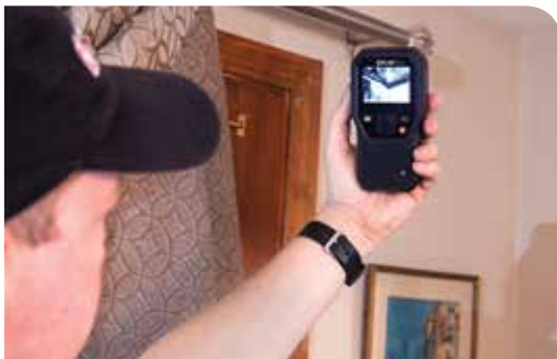
Das FLIR MR160 überprüft einen Decken-/Wandbereich auf Feuchtigkeitsprobleme

Das MR160 bietet einen integrierten Sensor für die nicht-invasive/berührungslose Messung und einen externen Kontaktsensor für die herkömmliche invasive Messung. Dadurch bietet es Ihnen die Flexibilität, sich von Fall zu Fall vor Ort für das passende Messverfahren zu entscheiden. Mit dem in der Baubranche einzigartigen MR160 bietet Ihnen FLIR ein revolutionäres Messgerät an. Als perfekte Ergänzung zu Ihrer hochauflösenden Wärmebildkamera, lässt sich das handliche Messgerät überall mit hinnehmen und beliebig einsetzen. Damit können Sie verborgene Feuchtigkeitsprobleme entdecken und noch effizienter zuverlässige, aussagekräftige Daten gewinnen.